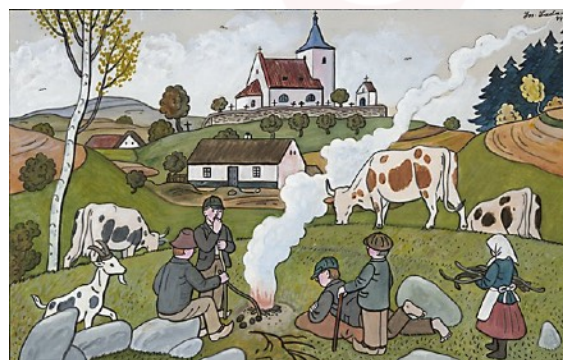
Josef Lada - Podzim